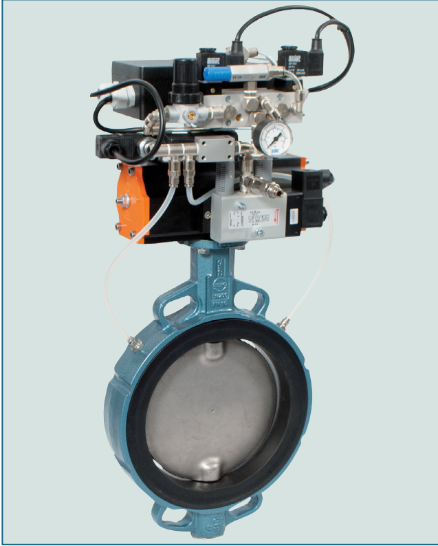
Şişebilir laynerli Z011-A tip Kauçuk Contalı Vana.